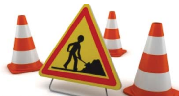
Figure 1:

La signalisation est mise en place pour de bonnes raisons, il est de mise de respecter les directives et respecter la zone des travailleurs. C'est pour votre sécurité et celle des ouvriers. De plus, il est primordial de ne pas pénétrer à l'intérieur d'un chantier . C'est une question de respect pour les travailleurs, faites leur confiance, ce sont des gens compétents et talentueux, et c'est aussi une question de sécurité pour vous.